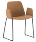
Sled base armchair Sillón pie de varilla + upholstered arms / brazos tapizados