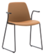
Sled base armchair Sillón con pie varilla