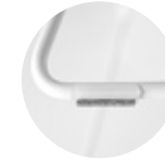
Felt glides for rod Tacos fieltro para varilla