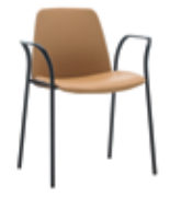
4 leg w/aluminum arms Sillón 4 patas + brazos aluminio