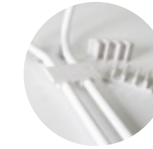
Linking clips Clips de unión