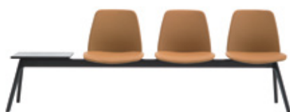
Bench 2-5 seater Banco 2-5 plazas