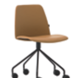
Steel swivel base Base giratoria de acero + casters / ruedas