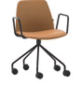
Steel swivel base Base giratoria de acero + metal arms / brazos metálicos + casters / ruedas