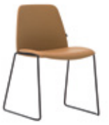
Sled base Pie de varilla