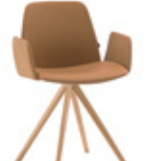
Wooden swivel base Base de madera giratoria + upholstered arms / brazos tapizados