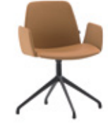
Aluminum swivel base Base giratoria de aluminio + upholstered arms / brazos tapizados