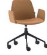
Aluminum swivel base Base giratoria de aluminio + upholstered arms / brazos tapizados + casters / ruedas