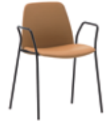
4 leg w/steel arms Sillón con 4 patas