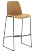
Sled base stool Taburete base varilla high / alto