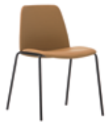
4 leg 4 patas