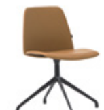
Aluminum swivel base Base giratoria de aluminio