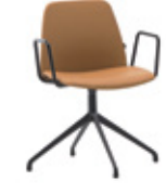
Aluminum swivel base Base giratoria de aluminio + metal arms / brazos metálicos