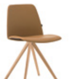
Wooden swivel base Base de madera giratoria