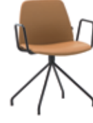
Steel swivel base Base giratoria de acero + metal arms / brazos metálicos