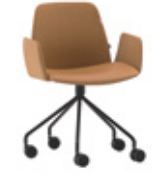
Steel swivel base Base giratoria de acero + upholstered arms / brazos tapizados + casters / ruedas