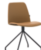
Steel swivel base Base giratoria de acero