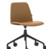
Aluminum swivel base Base giratoria de aluminio + casters / ruedas