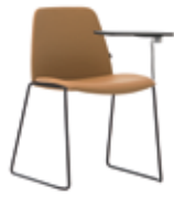
Sled base Pie de varilla + writing tablet / pala escritura