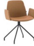
Steel swivel base Base giratoria de acero + upholstered arms / brazos tapizados