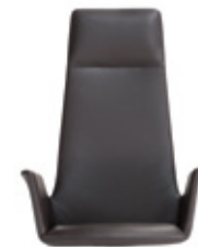
— High XL Alto XL