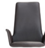
— High Alto