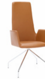
— HB with trestle swivel base RA con base giratoria piramidal