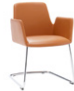
— Cantilever base Pie de patin