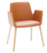
— 4 wooden leg base Pie 4 patas de madera