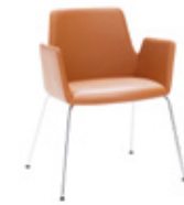
— 4 leg base Pie 4 patas