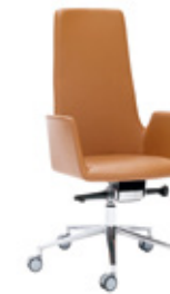
— HB with aluminium swivel base RA base giratoria aluminio + casters / ruedas