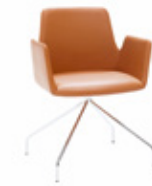
— Trestle swivel base Base giratoria piramidal