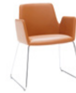
— Sled base Pie varilla