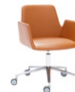
— Aluminium swivel base Base giratoria aluminio + casters / ruedas